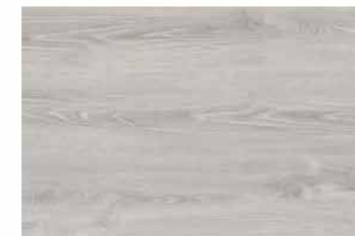
Caja de Piso Flotante Moon Light 10 láminas / 2.36 m 2