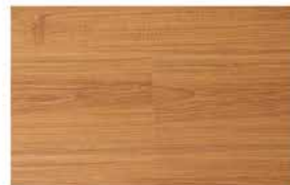
Caja de Piso Flotante German Cherry 10 láminas / 2.36 m2