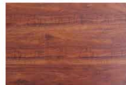
Caja de Piso Flotante Chanul 10 láminas / 2.36 m2