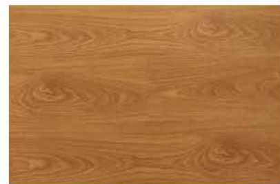
Caja de Piso Flotante Red Oak 10 láminas / 2.36 m2