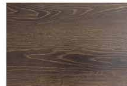
Caja de Piso Flotante Coffee House 10 láminas / 2.36 m2