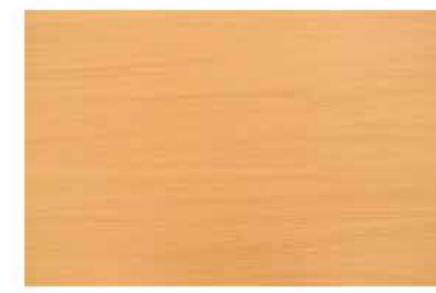
Caja de Piso Flotante Light Beech 10 láminas / 2.36 m 2