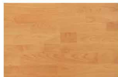
Caja de Piso Flotante Venetian Cherry 10 láminas / 2.36 m2