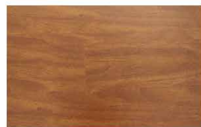
Caja de Piso Flotante Oriental Merbau 10 láminas / 2.36 m2