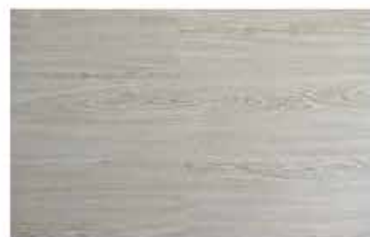
Caja de Piso Flotante Roble Noruego 10 láminas / 2.36 m2