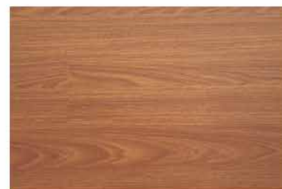
Caja de Piso Flotante Jatoba Royal 10 láminas / 2.36 m 2