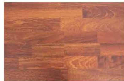
Caja de Piso Flotante Russian Merbau 10 láminas / 2.36 m2