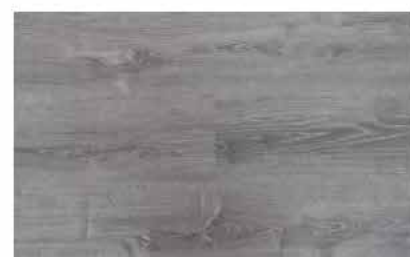
Caja de Piso Flotante Studio Gray 10 láminas / 2.36 m2