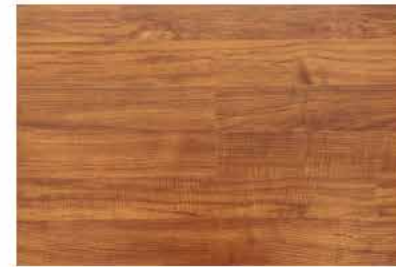
Caja de Piso Flotante Arrayan 10 láminas / 2.36 m 2