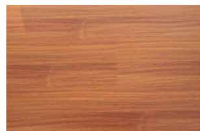
Caja de Piso Flotante Tangare 10 láminas / 2.36 m2