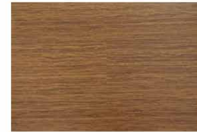
Caja de Piso Flotante Bambusa 10 láminas / 2.36 m 2