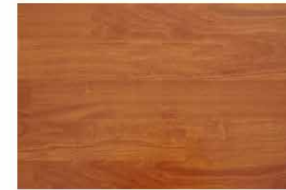
Caja de Piso Flotante Brazilian Teak 10 láminas / 2.36 m 2