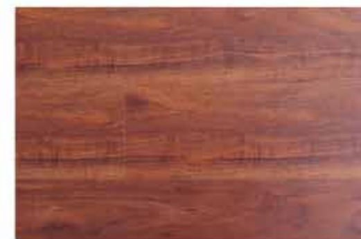
Caja de Piso Flotante Chanul 10 láminas / 2.36 m 2