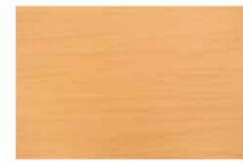
Caja de Piso Flotante Light Beech 10 láminas / 2.36 m 2