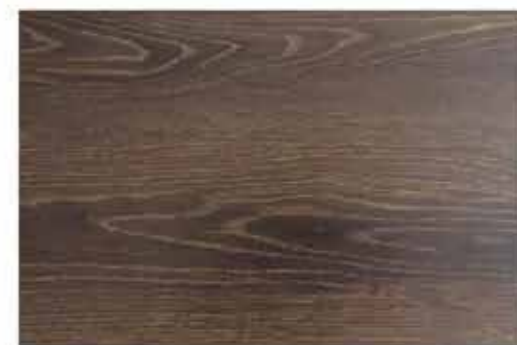
Caja de Piso Flotante Coffee House 10 láminas / 2.36 m 2