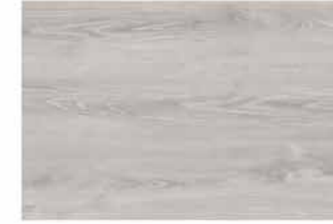
Caja de Piso Flotante Moon Light 10 láminas / 2.36 m 2