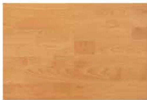
Caja de Piso Flotante Venetian Cherry 10 láminas / 2.36 m 2