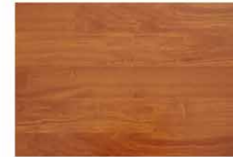
Caja de Piso Flotante Brazilian Teak 10 láminas / 2.36 m 2