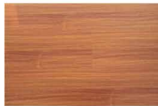
Caja de Piso Flotante Tangare 10 láminas / 2.36 m 2