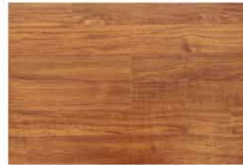
Caja de Piso Flotante Arrayan 10 láminas / 2.36 m 2