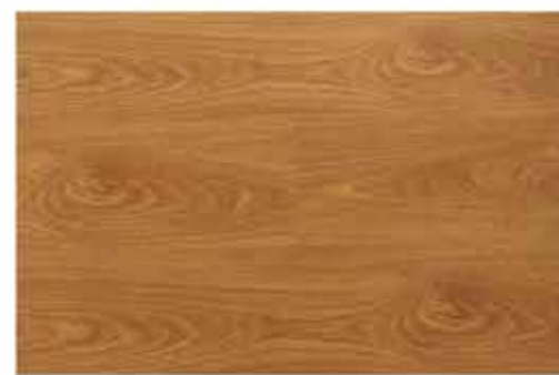
Caja de Piso Flotante Red Oak 10 láminas / 2.36 m 2