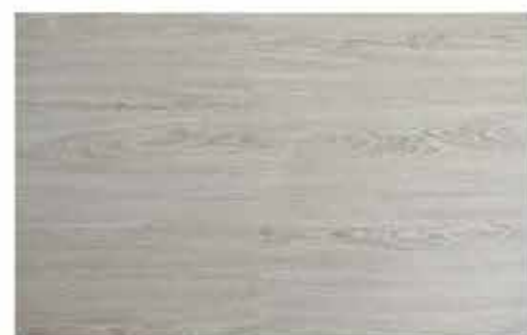
Caja de Piso Flotante Roble Noruego 10 láminas / 2.36 m 2