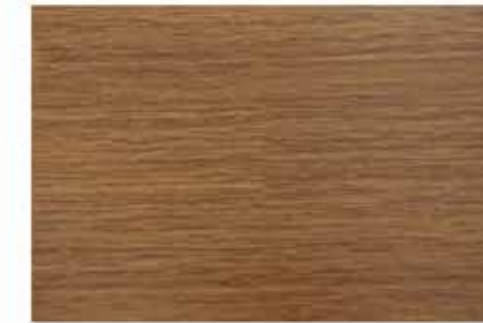
Caja de Piso Flotante Bambusa 10 láminas / 2.36 m 2