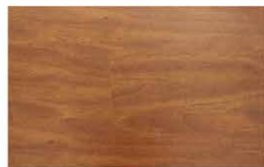
Caja de Piso Flotante Oriental Merbau 10 láminas / 2.36 m 2