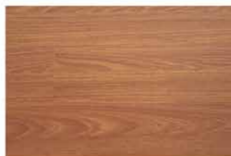
Caja de Piso Flotante Jatoba Royal 10 láminas / 2.36 m 2