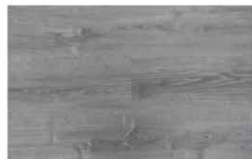
Caja de Piso Flotante Studio Gray 10 láminas / 2.36 m 2