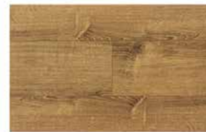
Caja de Piso Flotante Oat Straw 12 láminas / 2.40 m2