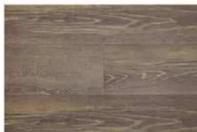
Caja de Piso Flotante Coffee House 12 láminas / 2.40 m2