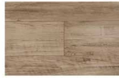
Caja de Piso Flotante Urban Grey 12 láminas / 2.40 m2