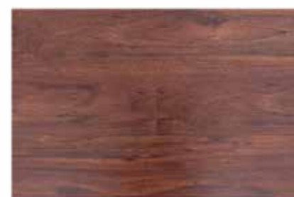
Caja de Piso Flotante Chanul 12 láminas / 2.40 m2