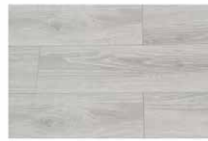
Caja de Piso Flotante Moon Light 12 láminas / 2.40 m2