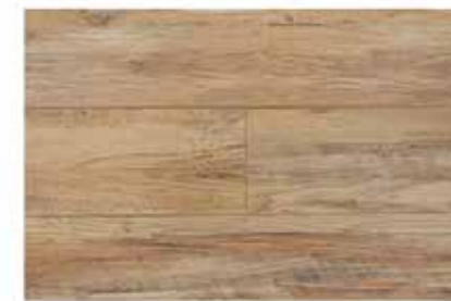
Caja de Piso Flotante Tan Cedar 12 láminas / 2.40 m2