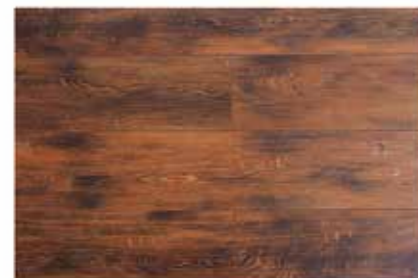
Caja de Piso Flotante Sweet Acacia 12 láminas / 2.40 m2