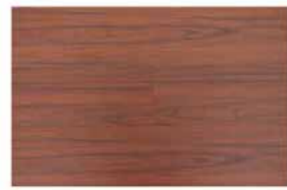
Caja de Piso Flotante Ipe 12 láminas / 2.40 m2