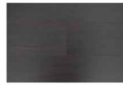
Caja de Piso Flotante Wenge 12 láminas / 2.40 m2