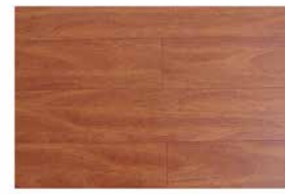
Caja de Piso Flotante Iroko 12 láminas / 2.40 m2