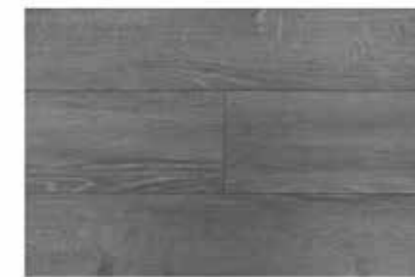
Caja de Piso Flotante Studio Gray 12 láminas / 2.40 m2