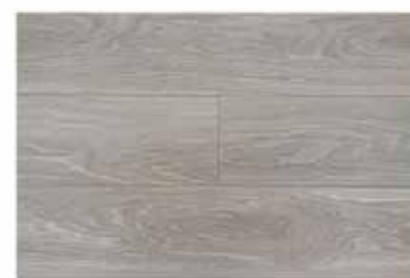
Caja de Piso Flotante Belopa 12 láminas / 2.40 m2