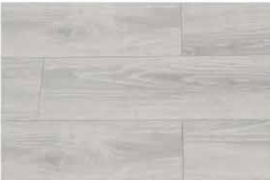
Caja de Piso Flotante Moonlight 8 láminas / 1.603 m 2