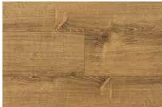
Caja de Piso Flotante Oat Straw 8 láminas / 1.603 m 2