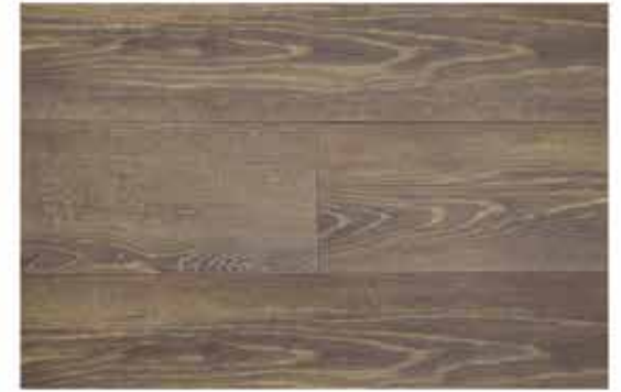
Caja de Piso Flotante Coffee House 8 láminas / 1.603 m 2