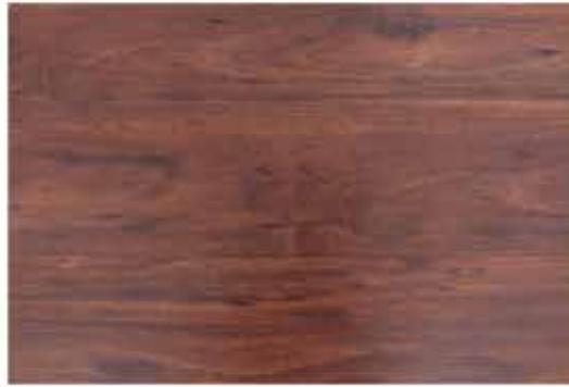
Caja de Piso Flotante Chanul 8 láminas / 1.603 m 2