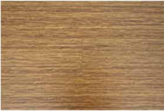
Caja de Piso Flotante Bambusa 8 láminas / 1.603 m 2