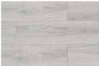
Caja de Piso Flotante Moonlight 8 láminas / 1.603 m 2