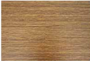
Caja de Piso Flotante Bambusa 8 láminas / 1.603 m 2