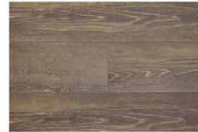
Caja de Piso Flotante Coffee House 8 láminas / 1.603 m 2