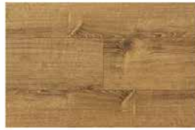
Caja de Piso Flotante Oat Straw 8 láminas / 1.603 m 2