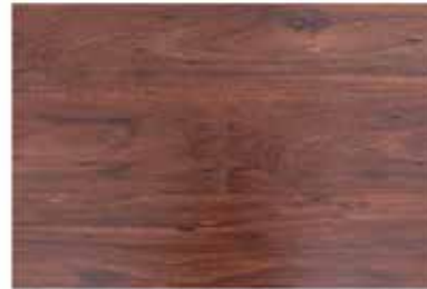
Caja de Piso Flotante Chanul 8 láminas / 1.603 m 2